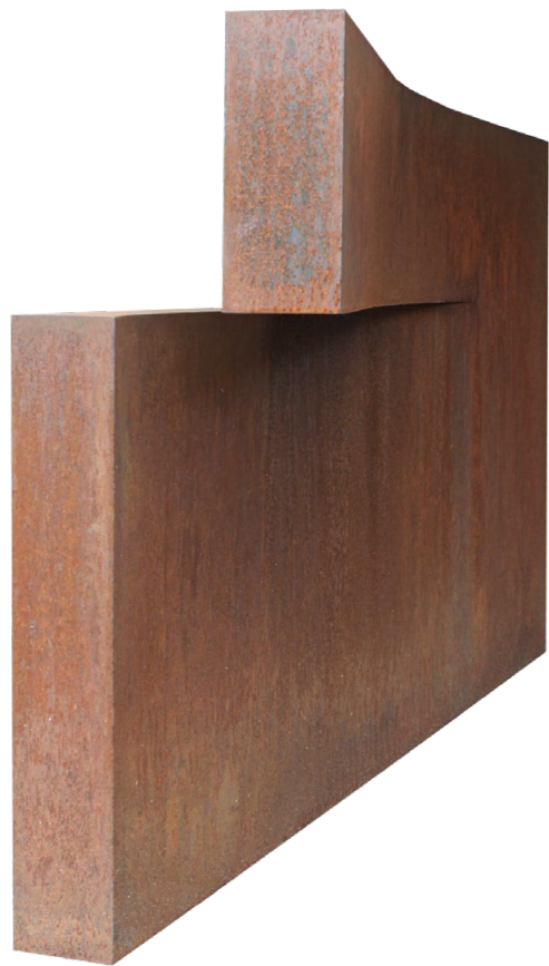
Jürgen Heinz, Monument II, 180 x 100 x 12 cm, 2007